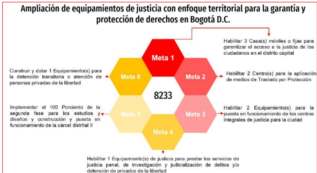
Imagen N°01. Actividades Proyecto de Inversión 8233

A continuación, se relaciona las actividades del proyecto de inversión en mención: